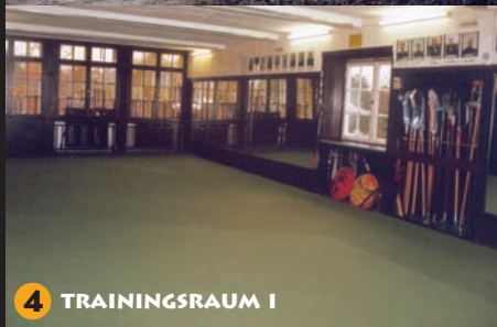
4 TRAININGSRAUM I