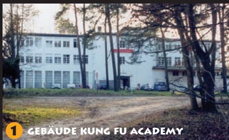
1 GEBÄUDE KUNG FU ACADEMY

Bewegungsformen (mit und ohne Waffen) fällt eine besondere Bedeutung innerhalb des Systems zu, da sie als sichtbarer Teil einer Kampfkunst auch das Können des Lehrers widerspiegeln. Diese choreografischen Bewegungsabläufe schulen Auge, Timing, Rhythmusgefühl und das Verständnis für Kampfbewegungen. Die Grundidee der WHKD-Philosophie ist, jedem Suchenden die Möglichkeit zu geben, eigene und somit natürliche Ausdrucksformen zu entdecken und zu kultivieren. Das Wun Hop Kuen Do-Kung Fu (mandarin: Quarn Hur Chuen Dao) wird als stillerer Stil bezeichnet, weil es ständigen Wandlungen unterworfen ist.